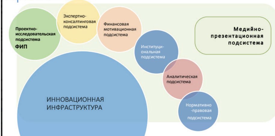
Рис. 2. Схема инновационной структуры системы образования.

Инновационные площадки в общем образовании проводят разработку, апробацию и/или внедрение новых технологий, средств обучения, примерных образовательных программ, инновационных образовательных про-